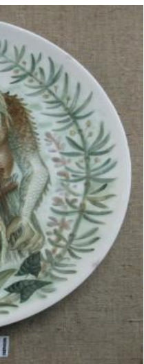
Таріль "Водяний", 1971.