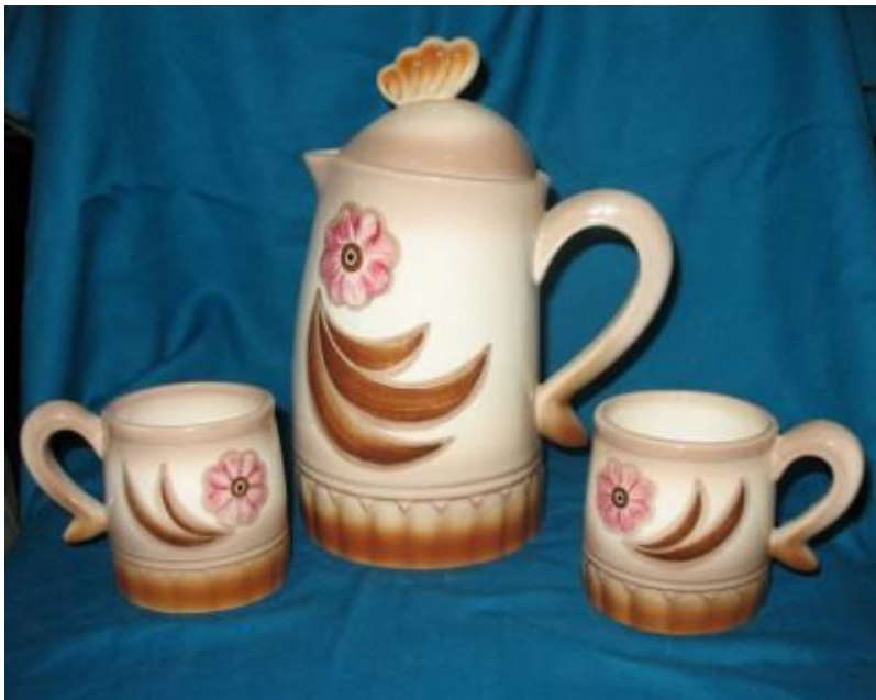
Набір для напоїв «Півень», 1966.