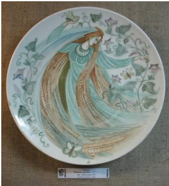
Таріль "Польова русалка", 1971.

Будянський фаянсовий завод був найкрупнішим підприємством фарфоро-фаянсової промисловості України. Його засновано у 1887 М.С.Кузнецовим як фарфоро-фаянсову фабрику. 1888 офіційне відкриття відбулося. Від 1890 підприємство перебувало у складі фарфоро-фаянсового концерну «Т-во М.С.Кузнецова». 1894-1904 на фабриці виготовлявся також фарфор. Декор вирізнявся високою технологічною якістю, в художньому плані – еkleктичний: переважали неоромантичні імпровізації за мотивами стилів рококо, ампіру, найбільш виразні вироби в стилі модерн (техніки: друк, деколь, аерограф)