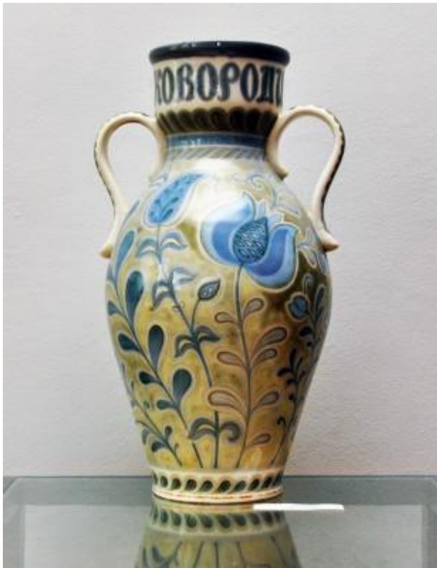
Вази "Ювілею Сковороди", 1973.