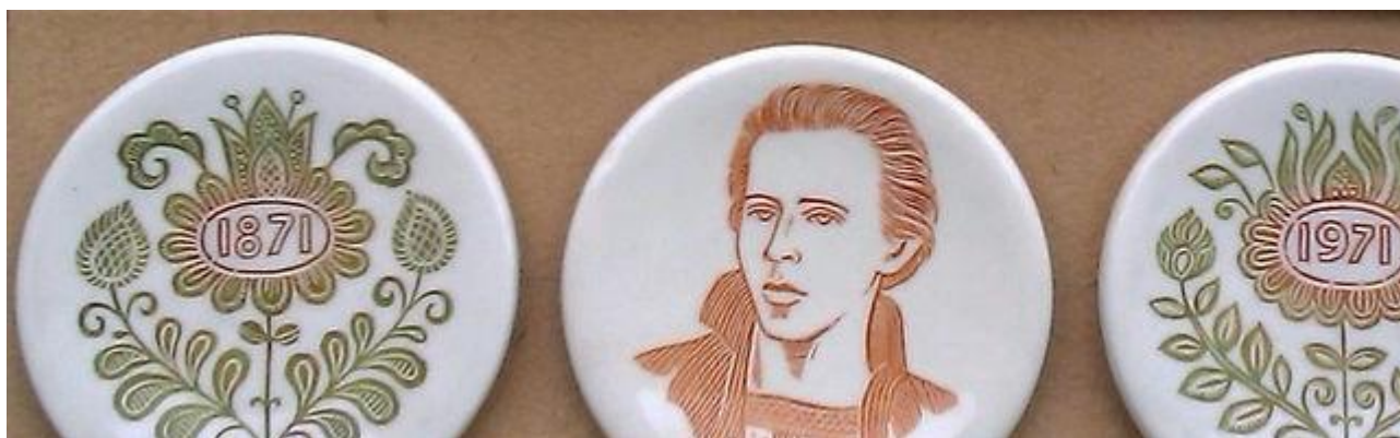
М. Ніколаєв. Набір "Ювілейний віночок" (3). Д. 7. Будянський ФЗ. 1970. Експонувався на республіканській художній виставці "100 років від дня народження Лесі Українки"