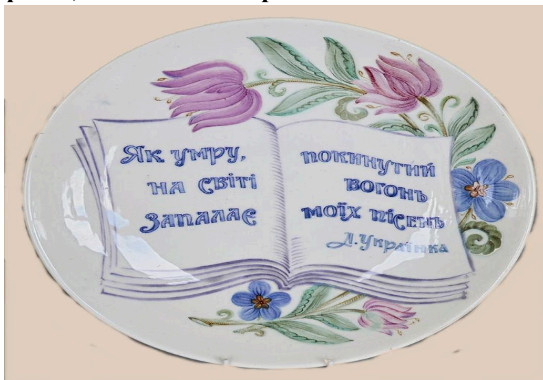
М. Ніколаєв. Декоративне блюдо «Ювілейне». Д. 30. Будянський ФЗ. 1970. Експонувалося на республіканській художній виставці "100 років від дня народження Лесі Українки". З історико-краєзнавчого музею сел. Буди