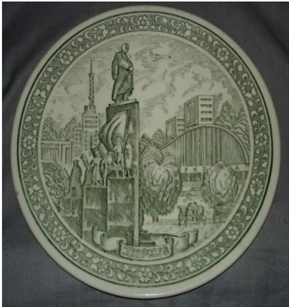
Таріль декоративний "Шевченко", 1963