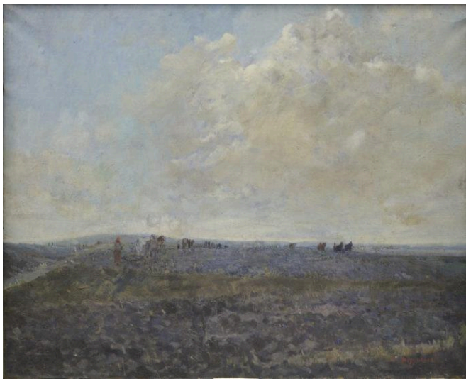
Безуглий Данило Іванович (1914 – 1977) « Рідні поля», Полотно, олія. 77 × 107.