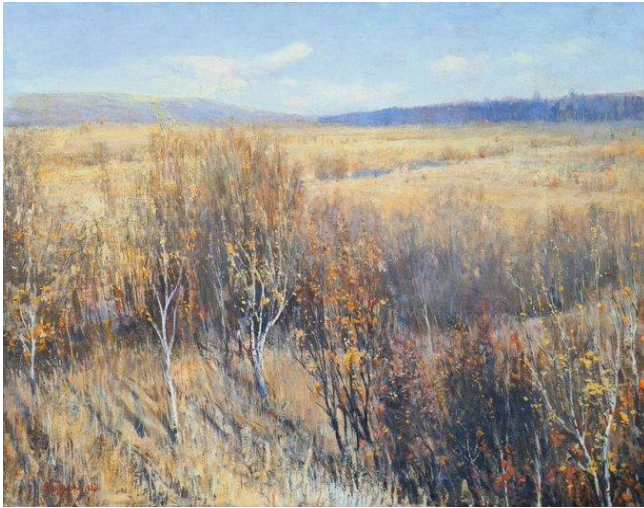
Безуглий Данило Іванович (1914 – 1977) "Жовтень", 1952 рік.