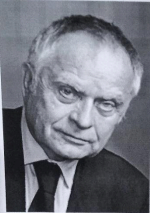
Дмитро Васильович Павличко (1929–2023) – український поет та громадський діяч

95 років від дня народження Дмитра Васильовича Павличка 28.09.1929 – 29.01. 2023 поета, перекладача, літературного критика, публіциста, шістдесятника, громадсько-політичного діяча, Героя України