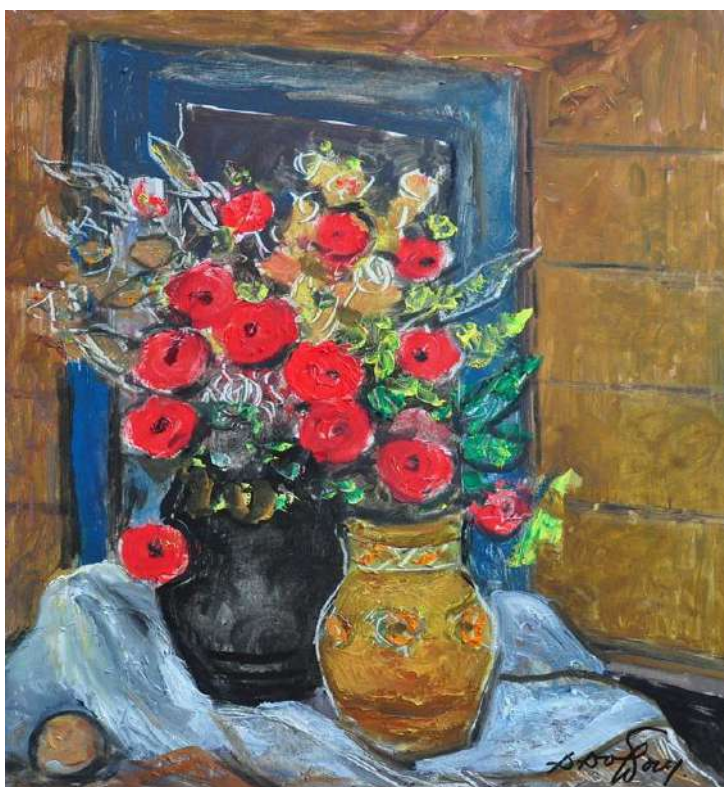
Натюрморт з маками